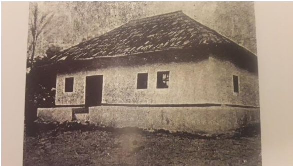
Casa părintească din Bardar în care s-a născut Sfântul Ierarh Dionisie (imagine din 1938)